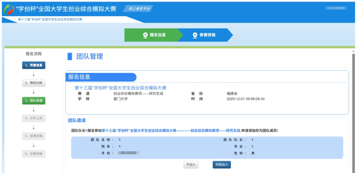
团队成员同意邀请